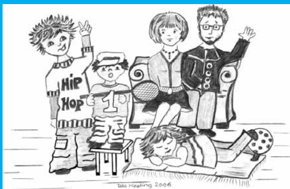
Gezeichnet von Uta Kesting

Eine Arbeitsgemeinschaft für die Anliegen von Eltern, Kindern und Jugendlichen in Buchloe