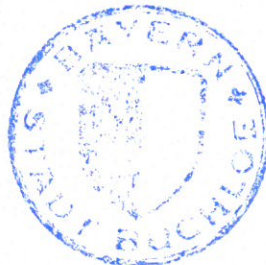
Robert Pöschl Erster Bürgermeister