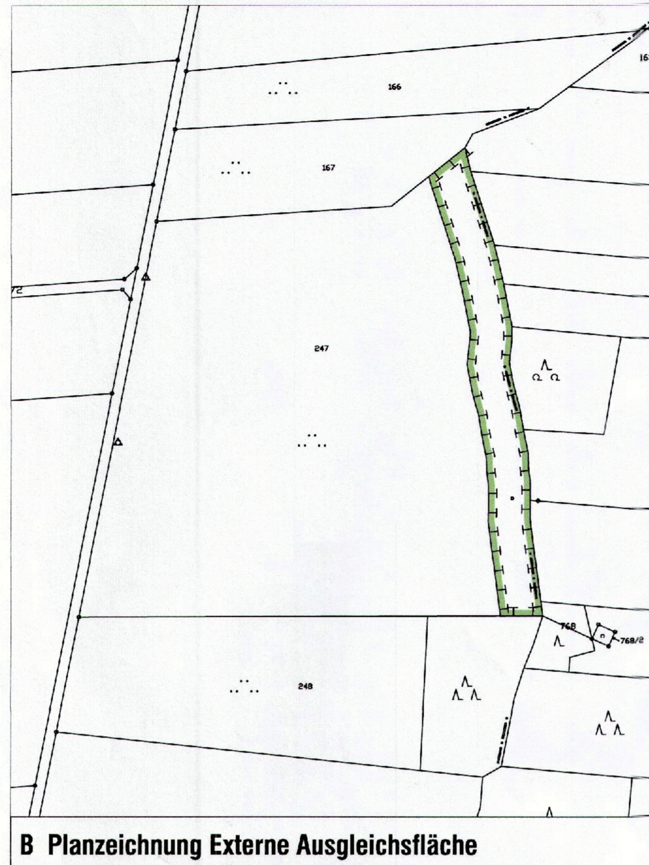
B Planzeichnung Externe Ausgleichsfläche

bestehende Grundstücksgrenzen 1564 Flurstücksnummern bestehende Haupt- und Nebengebäude bestehende Böschung